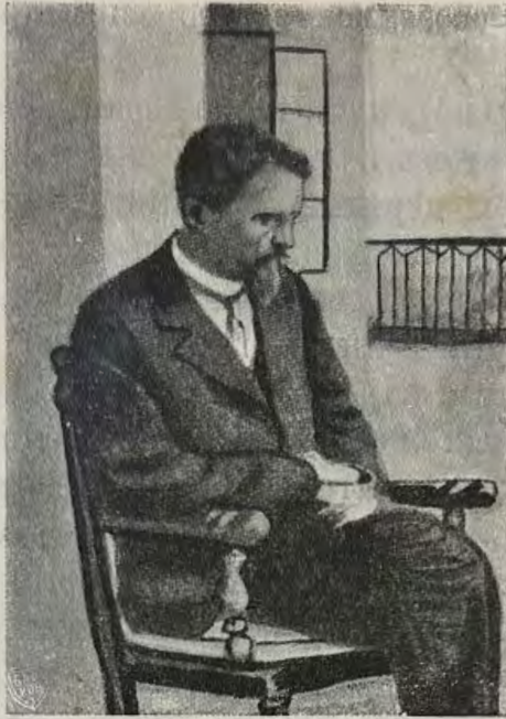
А. П. въ Крыму.