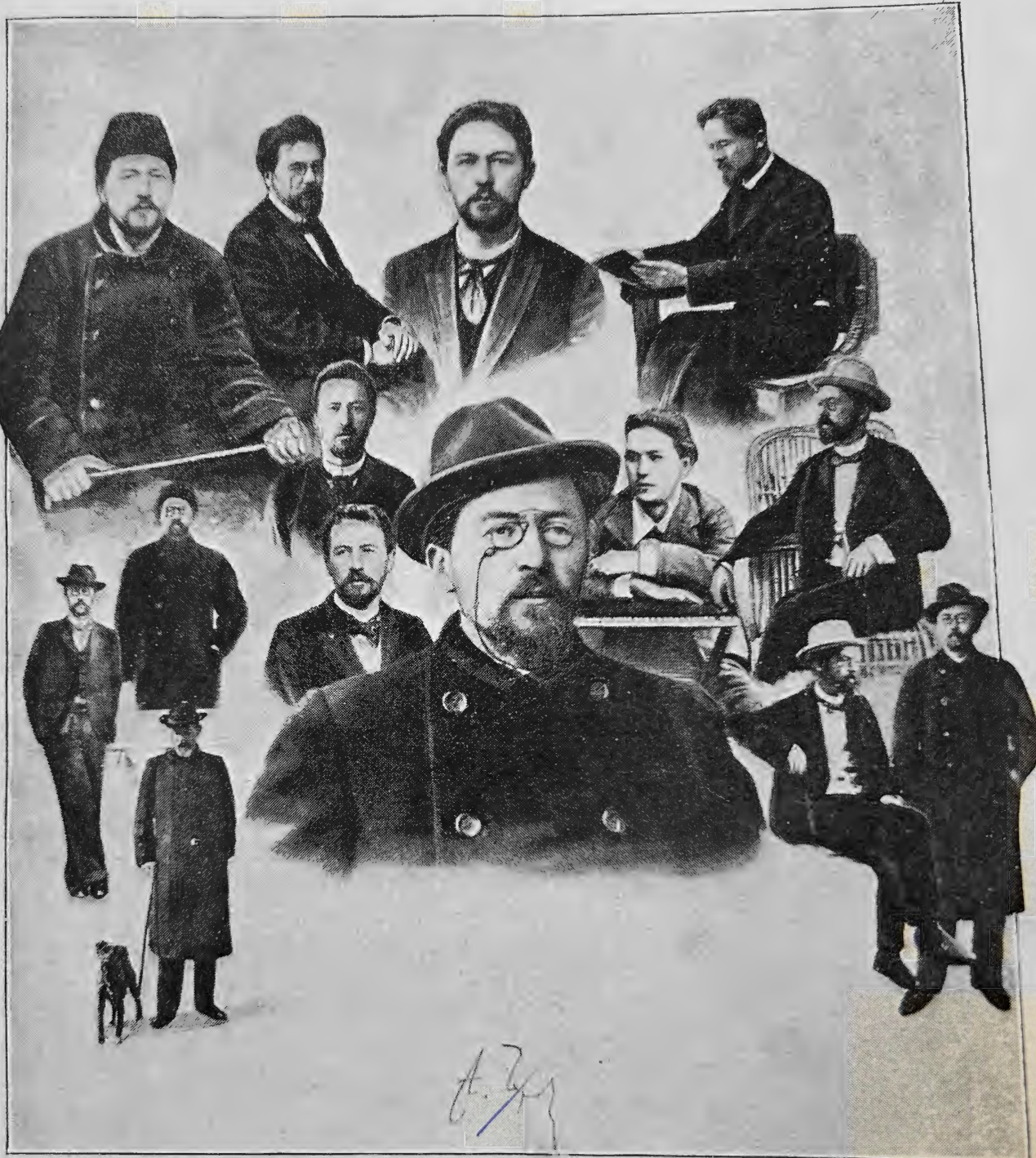
А. П. Чеховъ въ разные годы своей жизни.